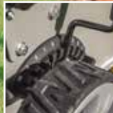
Keskitetty korkeudensäätö, 13 asentoa.