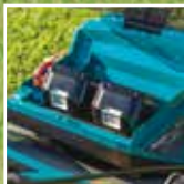
Akut sijaitsevat suojaossa vedeltä ja roiskeilta.