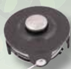
196146-9 Siimakela sisältäen siiman. DUR181