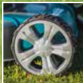
Suuret kuulalaakeroidut pyörät.