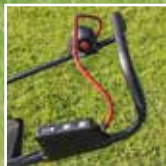
Varaustilan näyttö, virtakytkin ja hiljainen tila.