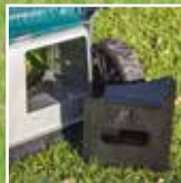
Biroleikkaus adapterin avulla.